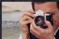
AN EDUCATION p.42