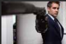
LONDON BOULEVARD p.48