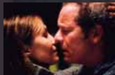
KISS OF LIFE p.44