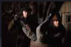
CADAVRE À LA PELLE p.28