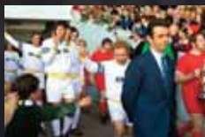
THE DAMNED UNITED p.24