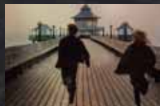
NEVER LET ME GO