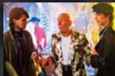
KILLING BONO p.50