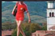
CIRKUS COLUMBIA p.14