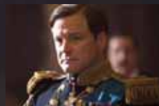
THE KING'S SPEECH