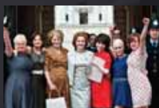
WE WANT SEX EQUALITY p.36