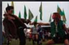
YOU INSTEAD p.54