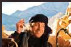
Mr NICE p.16