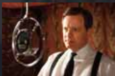
THE KING'S SPEECH p.12