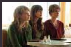
NEVER LET ME GO p.26