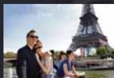
AN EDUCATION p.42