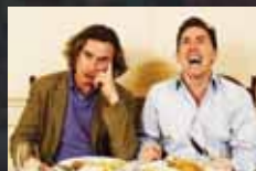
THE TRIP p.32