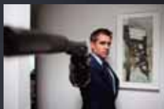
LONDON BOULEVARD p.48