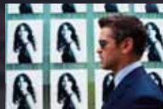
LONDON BOULEVARD p.48