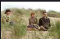
NEVER LET ME GO p.26