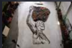
WASTE LAND p.20