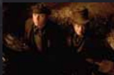
CADAVRES À LA PELLE p.28