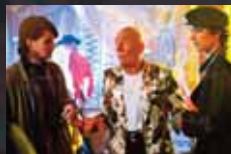
KILLING BONO p.50