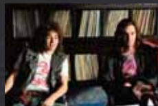
KILLING BONO p.50