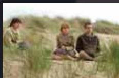
NEVER LET ME GO p.26